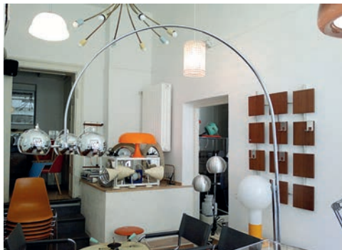
Charme der Siebziger: PAPPILLON

Retro – das Wort fungiert beinahe als Qualitätssiegel, so angesagt sind nach wie vor Retrofashion und – Design. Während die Mainstreammarken sich eifrig an dem Style vergangener Jahrzehnte anlehnen und damit die breite Masse bedienen, kaufen echte Fans nicht nachgemachte Neuware, sondern original Vintage. Das Einkaufserlebnis in Münchens Vintage-Läden ähnelt einer Schatzsuche – Zeitreise feeling inklusive. Ausprobieren lohnt sich.